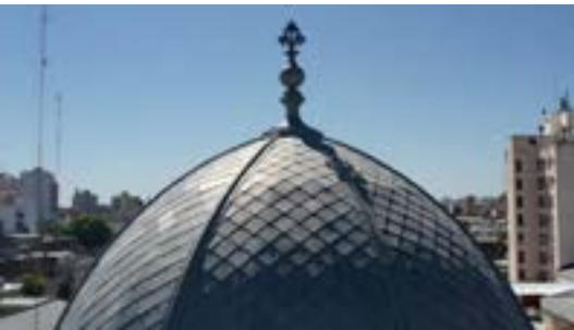
2020. Detalle vista de la Cúpula de estilo francés con pizarras de zinc y plomo

Éste fue un trabajo artístico, porque se fue dibujando y plegando chapa por chapa. Luego, se trabajó con unos aristeros y para ello se tuvo que hacer la matriz para poder, después, estampar la chapa para que respon-