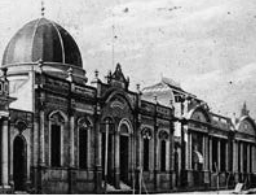
Fachada del Palacio Legislativo 1907 - 1927