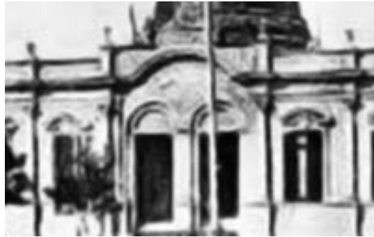
1907-1927 Vista frontal del edificio. Acceso de doble arcada con una columna central.

De allí que en el frente, figuren en sobre relieve dos fechas: 1905 por el definitivo comienzo de las obras y 1927 recordando la primera y única modificación del edificio con respecto al proyecto original de 1905.