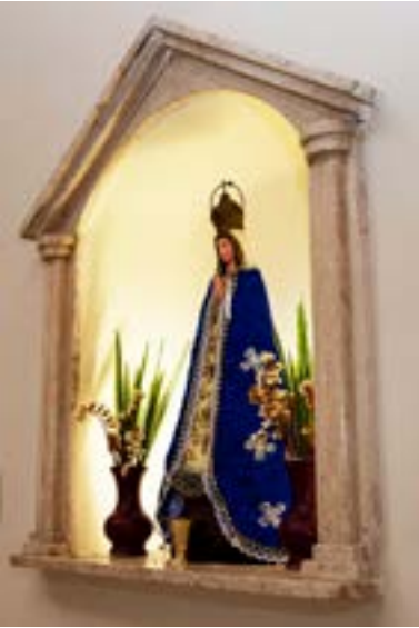
2019. Vestíbulo - Virgen Nuestra Señora de Itatí.

Vestíbulo: En él, desde el año 1998, se encuentra entronizada la imagen de la Virgen Nuestra Señora de Itatí, como así también Placas recordatorias, entre las que se destaca la del General José Francisco de San Martín.