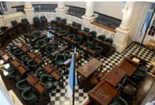
2020. Recinto de Sesiones. Vista aérea central.

confeccionada en bronce, que domina desde las alturas al semi-círculo legislativo (ubicación de las bancas). En el nivel o galería superior, se ubica el público. En el inferior, además del público y en un sector otorgado especialmente, los periodistas y asistentes de los legisladores desarrollan sus respectivas tareas. En el centro