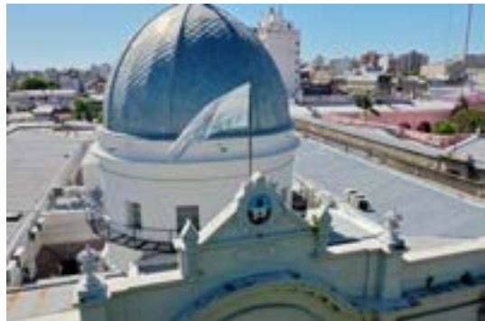
2020. Vista aérea de la Cúpula.

Los espacios que se procedió a refaccionar y restaurar fueron desde los techos, la fachada y acceso al Palacio Legislativo, el vestíbulo oval de acceso, los salones de Acuerdos y Pasos Perdidos, y el Recinto de Sesiones. El objetivo era renovarlos haciéndolos más accesibles y de tránsito más cómodo.