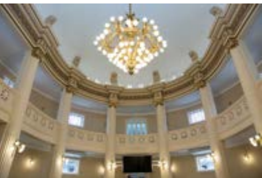
2020. Recinto de Sesiones. Vista de la Barra y la gran araña artesanal de setenta y dos lámparas.

puertas de dos hojas cada una, ubicadas a espaldas del estrado donde se ubica el Presidente secundado por la Secretaria y el Prosecretario, que comunica con el Salón de los Pasos Perdidos. Rodeando el recinto propiamente dicho, se ubica la BARRA que la conforman dos grandes balcones sostenidos por ocho columnas ornadas con luces. Se destaca, además, la gran araña artesanal de setenta y dos luces,