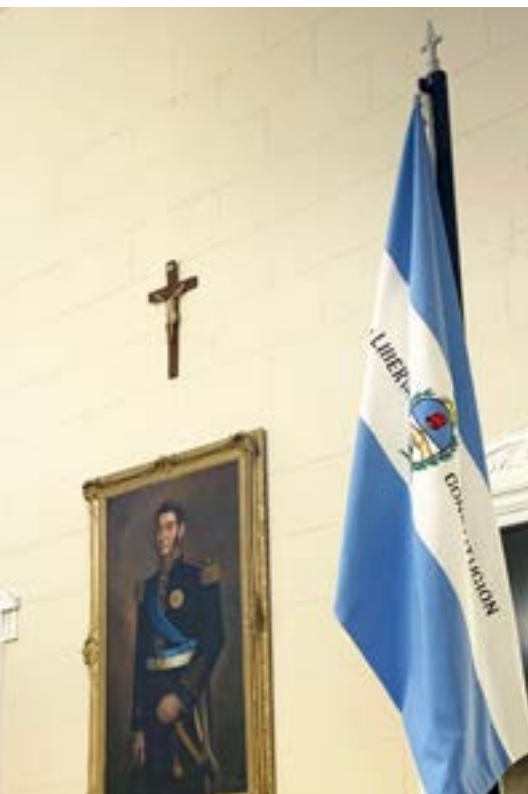
Bandera de Corrientes

Provincial que sigue al Congreso, en las deliberaciones sobre su disolución, sanciona la Ley N° 33, que en su artículo 14, en el segundo párrafo, establece que: