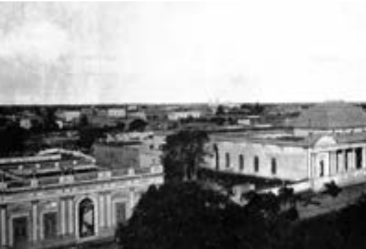
A fines del siglo XIX, donde actualmente se erige el Palacio Legislativo, sólo se encontraba la Casa de Gobierno y la Mansión Cabral, actualmente el Ministerio de Seguridad.

planos y presupuestos. Los sucesos político - militares de los años subsiguientes, postergaron el comienzo de la obra. Más tarde se actualiza la idea y se elige el terreno, entonces baldío, en el cual desde los remotos días coloniales había estado el cementerio de la Iglesia Matriz, templo éste que como se sabe, se levantaba en el actual sitio que ocupa el edificio de la Casa de Gobierno.