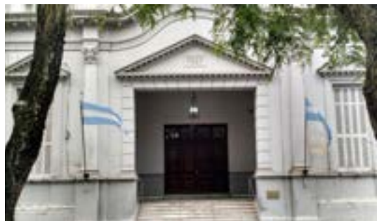
25/06/2016. Vista frontal del edificio. Acceso con escalera de marmol de carrara nacional.