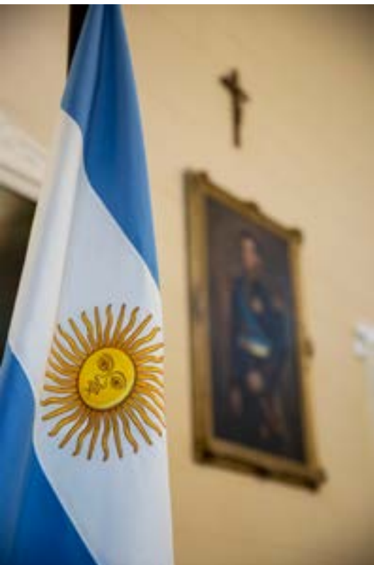
Bandera Nacional, Crucifijo y Retrato del Libertador de América.