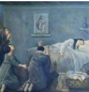
LAS CAUTIVAS de Miguel Pascarelli.