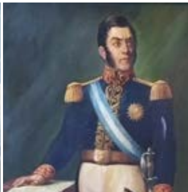
Retrato de JOSE FRANCISCO DE SAN MARTÍN de C. Espíndola.