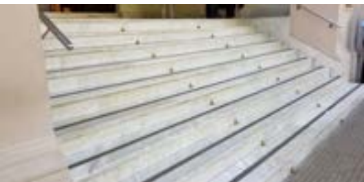
2019. Escalinatas de mármol de Carrara Italiano.

diera a la misma forma original previa, terminando en la cúpula que tenía un remate en su cima, que es de dos metros de altura y hubo de hacerse sobre el piso antes de colocarlo. Esa tarea la realizó un artista especializado en la materia, y constituyó la labor más grande y artesanal de todo el proyecto de refacción y restauración edilicia, ya que demandó siete meses de trabajo.