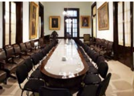
2019. Salón de Acuerdos "Dr. Raúl Alfonsín"

las paredes para determinar los colores originales que datan del siglo XX. El avance de la tecnología hizo necesario levantar el piso que ya no era original; por lo tanto se procedió a levantarlo en su totalidad, colocándose ductos para acceder a los micrófonos de cada una de las bancas, muchos de ellos, fuera de servicio; se reemplazaron cables, conexiones y consolas de sonido, incluidos parlantes. Se colocó el piso original de mosaicos calcáreos, con moldes de 25x25, cien por ciento hechos en Corrientes.