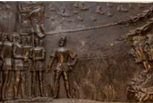
2019. Salón de los Pasos Perdidos. Mural en bajorelieve. Escultor: Juan María Sánchez

alfombra muy mullida y cuando los legisladores repasaban sus discursos “iban y venían, y se perdían los pasos y, a veces, las ideas” . Por su parte, los franceses llamaban “salle des pas perdus” (sala de los pasos perdidos) a la antecámara a la que accedían los visitantes antes de su admisión en la logia o sociedad secreta.